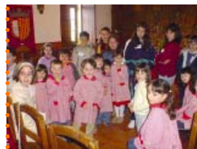
Sessão de leitura dedicada aos alunos dos jardins de infância do concelho