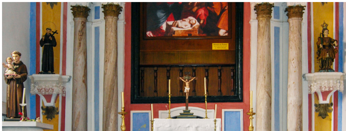
Capela do Convento de Santo António