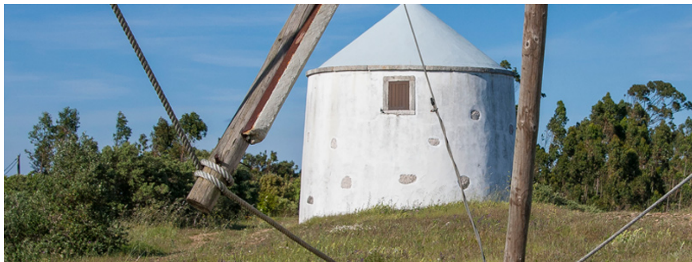
Moinhos da Pena

http://torrescode.cm-torresnovas.pt/lapas